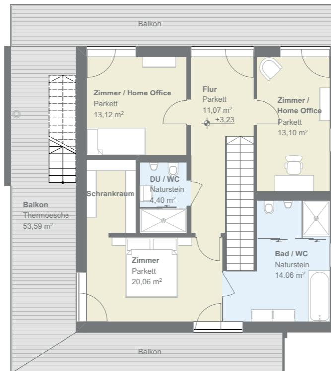
Obergeschoss Wohnfläche 76 m 2 Balkone 54 m 2